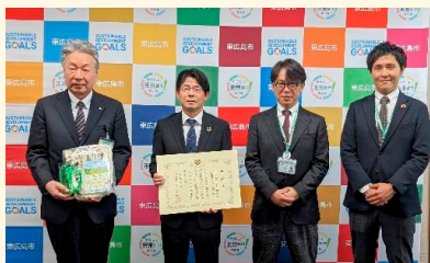
東広島市教育委員会への寄贈