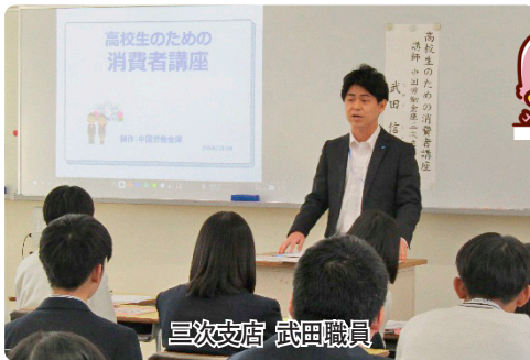
三次支店 武田職員