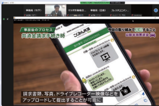
＜マイカー共済制度改定について＞

「マイカー共済の制度改定」では、社会的な要請を踏まえた自動車事故の被害者救済への対応および昨今の自動車を取り巻く社会環境の変化への対応など、2025年4月の改訂内容について、説明をおこないました。