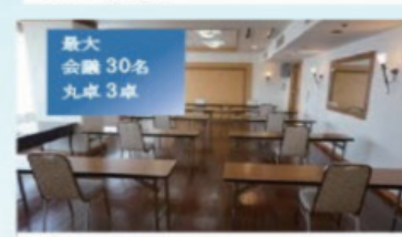
5F ノーブル ※ ソーシャルディスタンス設営例