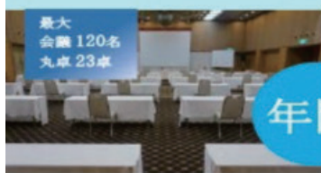
2F 鳳凰 (松竹梅)