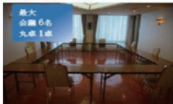
2F ルビー・トパーズ・サファイア