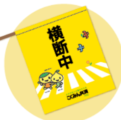
横断旗を全国に寄贈。