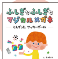
子どもたちのための交通安全デジタル絵本を公開。

「7才の交通安全プロジェクト」では、横断旗の寄贈や、特設サイトでの情報発信など、子どもたちの安全を守るための取り組みを行っています。